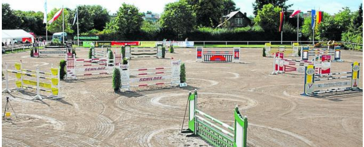
Es ist angerichtet: Der Reit- und Fahrverein Rüsselsheim-Haßloch freut sich, wieder viele Gäste auf den Rüsselsheimer Sportpferdetagen begrüßen zu dürfen.