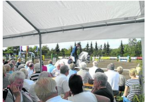
Mittendrin statt nur dabei: Die Zuschauer können das Geschehen auf dem Reitplatz aus nächster Nähe verfolgen.

Am Samstag, 31. August, treten die Teilnehmer zu Wettbewerben im Stilspringen und Dressurreiten an. Höhepunkt an diesem Tag ist die Barrierenspringprüfung unter Flutlicht. Zwischen 12.30 und 14 Uhr findet am Samstag außerdem die Siegerehrung für den diesjährigen Malwettbewerb statt. Im